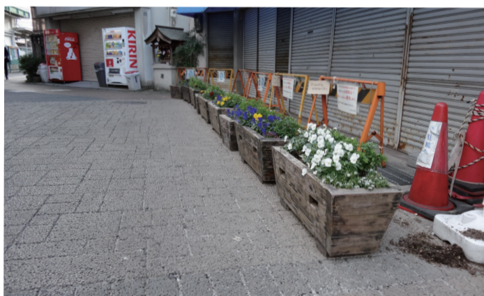
※阪急長岡天神駅西口

初議会で質問した内容は①阪急長岡天神駅周辺再整備②地域公共交通ビジョンについて、でした。当時、長岡天神駅西口の放置自転車が多く、緊急時には緊急車両が走行できないような状況でした。そこで、他市の例から「自転車を心理的に置きにくくする」取り組みを提案し、行政職員の皆さんが本市でも可能なものと考え、花壇の設置に至りました。この時に感じたことは、政策をしっかりと勉強をし、行政職員と話し合い、長岡京市のために一生懸命に働けば、「政党や会派に関係なく政策を実現できるんだ!」ということでした。